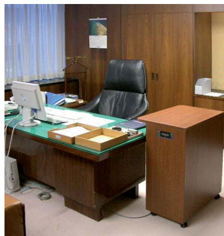
公司高层管理人员办公室