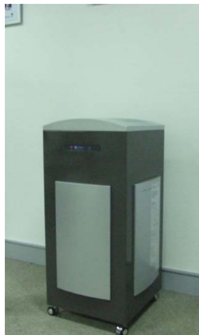
低柜型 CFSCHL-R 流线型设计，款式新颖