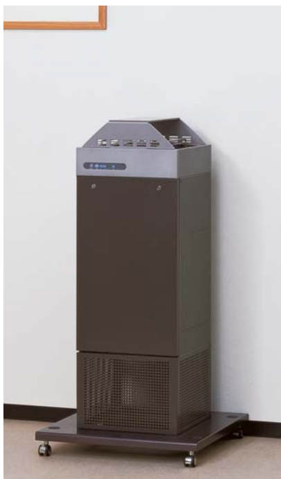
高柜型 CESCHH 适宜公共场所的高柜型