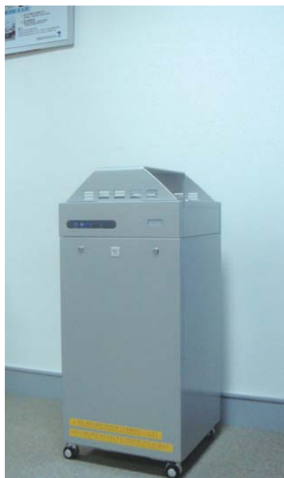
低柜型 CESCHL 最省空间的低柜型

TORNEX INDOOR AIR QUALITY CO., LTD. 上海统能克斯空气净化技术有限公司